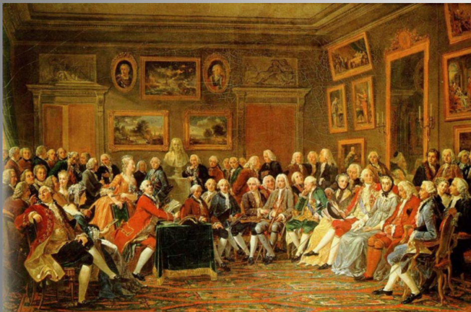
Lemmonier: Geoffrin asszony (1695-1777) szalonja