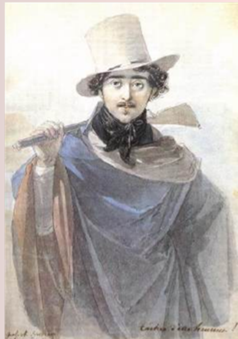
Nagycenk, Széchenyi kastély