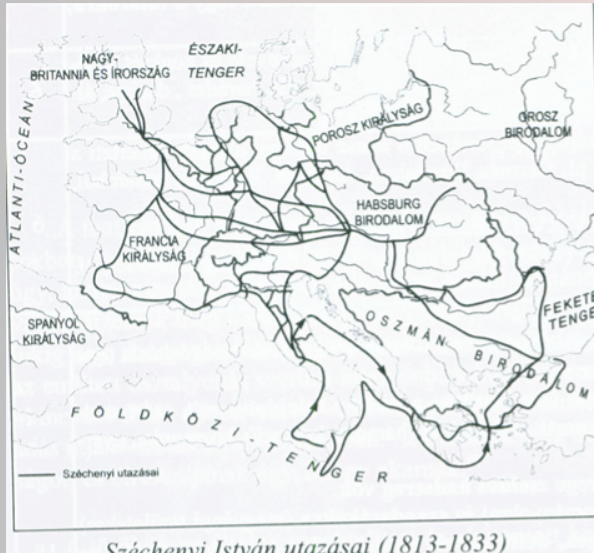
Széchenyi István utazásai (1813-1833)