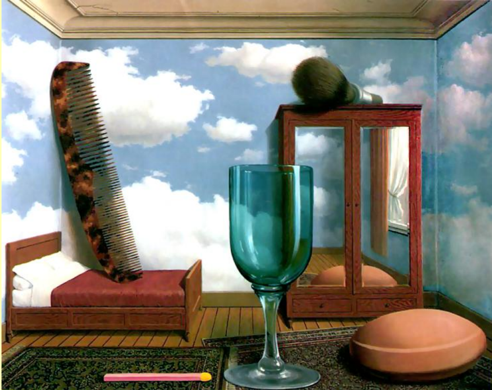
Magritte: Személyes értékek, 1952.